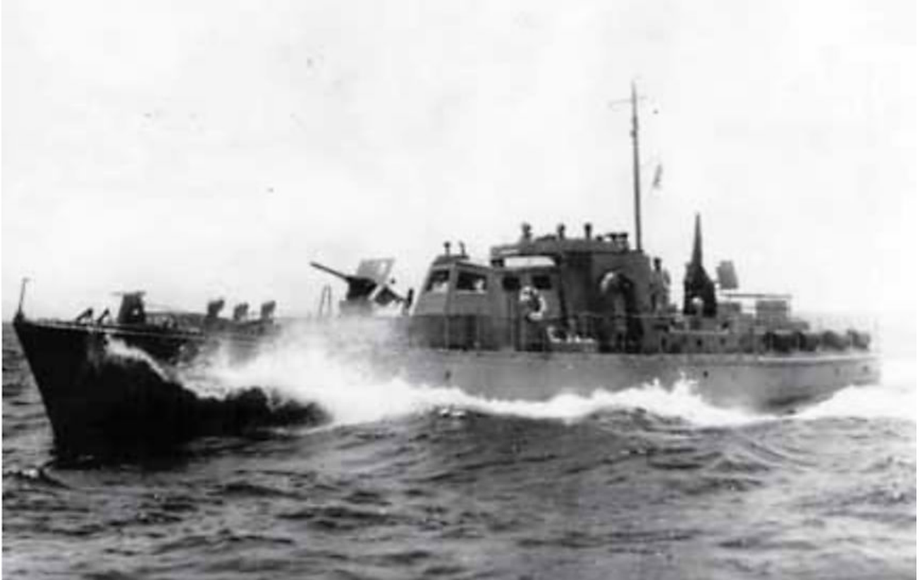
De Meda in actie