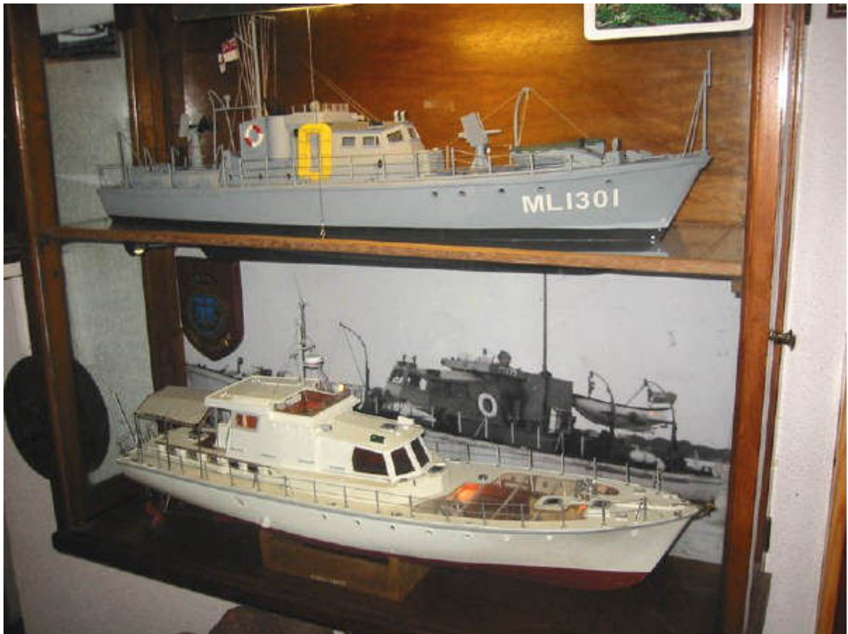
Als model nagebouwd, boven als oorlogsschip en onder als jacht