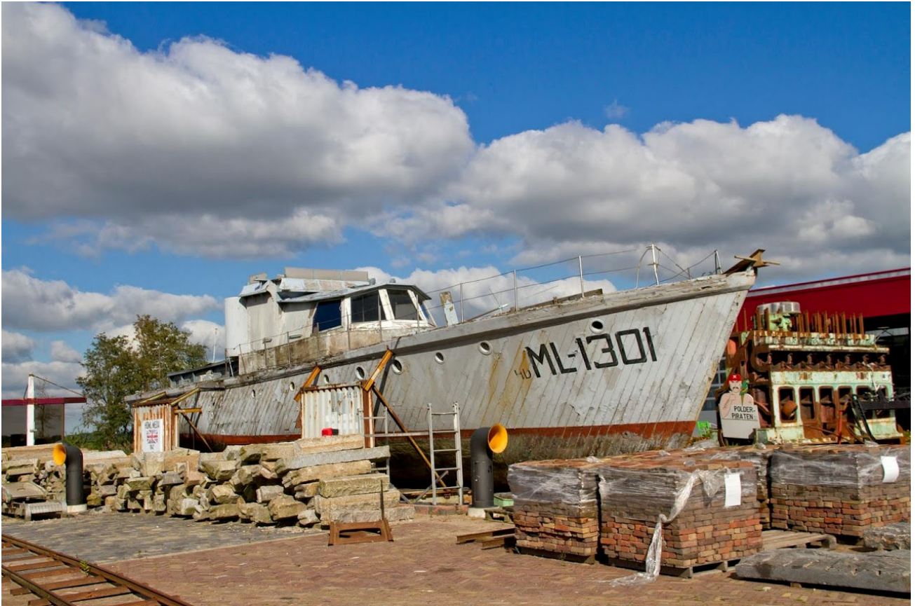
De Meda zoals het in 2017 in Dronten, bij het museum staat