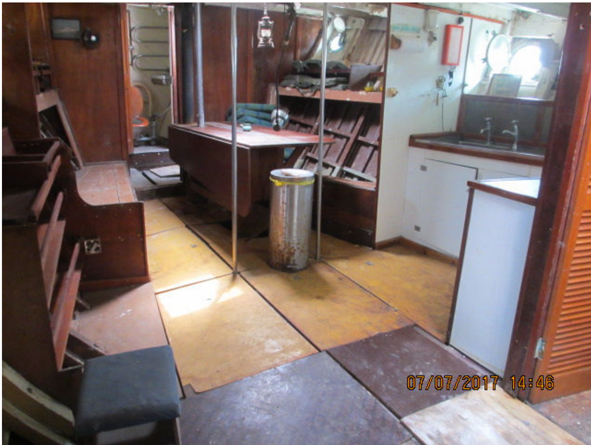
De Crew ruimte