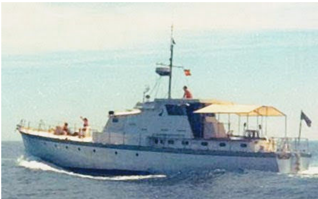
De Meda in de middelansche zee als jacht met de naam 'Gibal Tarik'